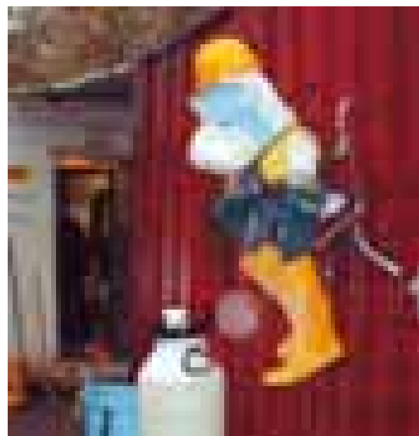
Pour le personnel du chantier, Sainte Barbe, patron des mineurs est représenté par un ours en peluche assis sur une chaise et équipé de vêtements et de casque de protection.

En zones non urbanisées, furent réalisées sur 1,8 km des tranchées ouvertes talutées selon les méthodes classiques, les tubes étant ensuite posés sur un lit de matériaux avec un recouvrement à l'aide de matériaux alluvionnaires de graves et argilo sableuses avant le compactage. La pente aura été de 1 mm/m pour la partie forcée en bordure de rivière et pour l'ensemble de l'émissaire de 1,8 mm/m, un ratio bien supérieur aux normes habituelles slovaques.