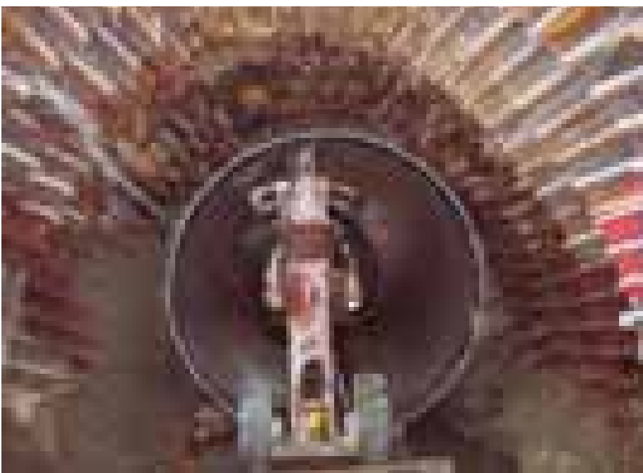
Mise en place d'un tuyau dans le tunnel à l'aide d'un gabarit

Ce réseau unitaire d'égouts à construire est situé au cœur d'une agglomération dense avec un trafic routier important. La première phase a été attribuée pour 2 millions € à Skanska BS Prievidza associé au slovaque Combin. Elle a consisté à réaliser 4,1 km d'émissaire et de conduites annexes par deux méthodes : en tranchée ouverte sur 1,8 km et avec un tunnelier à front